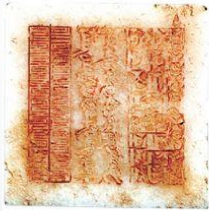
Шашин төрийг хослон баригч, Наран гэрэлт Богд хааны хаш эрдэнийн тамга. 1911 он