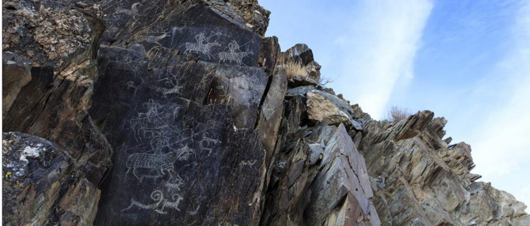
Ховд аймаг Эрдэнэбүрэн сум Цамбагаравын хадны зураг