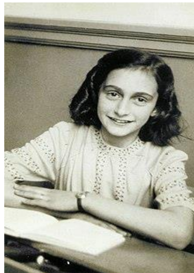
Анна Франк 1942 он

Түүнийг нас барсны дараа хэвлэгдсэн " Аннагийн өдрийн тэмдэглэл " ном нь дэлхийн сонорт хүрч алдаршсан билээ.