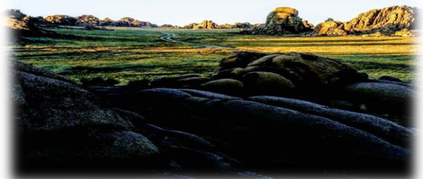
өлхөн - уужим, чөлөөтэй