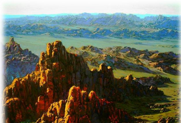
байц – хавцал бэрх газар