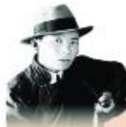
Их зохиолч Д.Нацагдорж Герман улсад суралцахаар явахдаа "Улаанбаатараас Берлин хүртэл" (1926.08.27) аян замын шүлэглэсэн тэмдэглэлээ бичжээ.